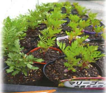
マリーゴールド！ 順調に育ってます！