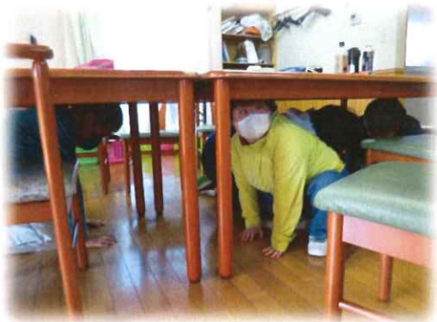
避難訓練風景！地震を想定した訓練です。