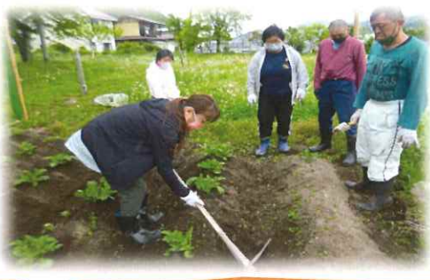
園芸活動！じゃが芋、枝豆も順調です。 草取りも終わり土寄せしてる様子です！