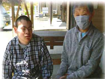
感染前のドライブ！ テラスでほのほの！