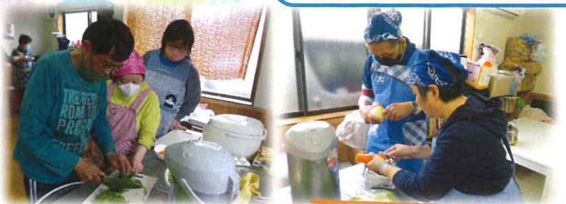
調理実習！頑張ったので味も格別でした！